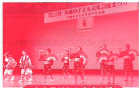
市内子どもの育成支援