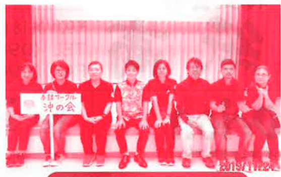
障がい者支援活動（手話）