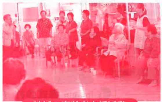
地域の高齢者支援活動