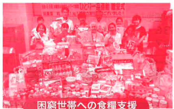
困窮世帯への食糧支援（フードバンク運動）